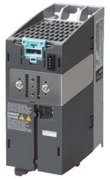
Figura similar / Figure similar