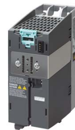
Figura similar / Figure similar