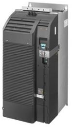
Figura similar / Figure similar