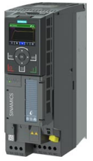
Figura similar / Figure similar