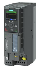
Figura similar / Figure similar