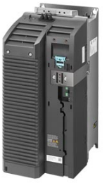
Figura similar / Figure similar