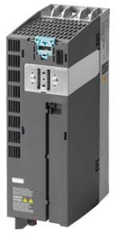
Figura similar / Figure similar