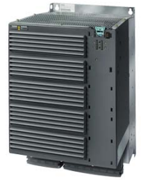
Figura similar / Figure similar