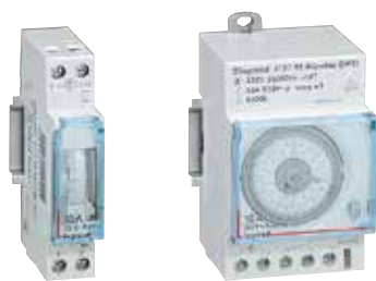
4 127 90