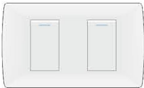
Contactos con punto de plata