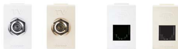
AE2152FEB AE2152FEM AE2182EB AE2182EM