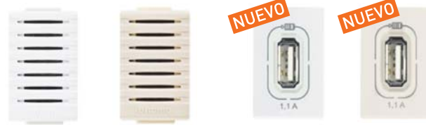
AE2049EB AE2049EM AE2090EB AE2090EM