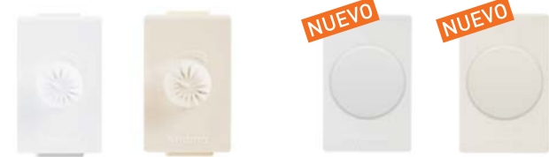
AE2355EB AE2355EM AE2056EB AE2056EM