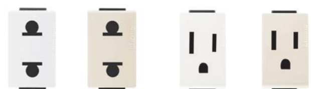
AE2125EB AE2125EM AE2128EB AE2128EM