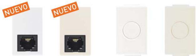
AE2079C6EB AE2079C6EM AE2000EB AE2000EM