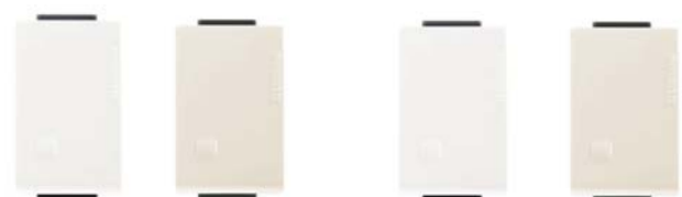
AE2001EB AE2001EM AE2003EB AE2003EM