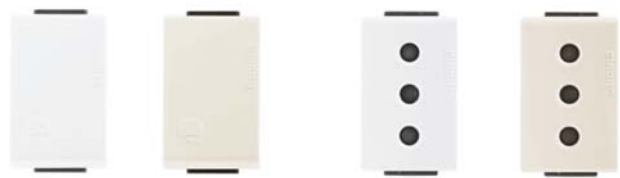
AE2005EB AE2005EM AE2113EB AE2113EM